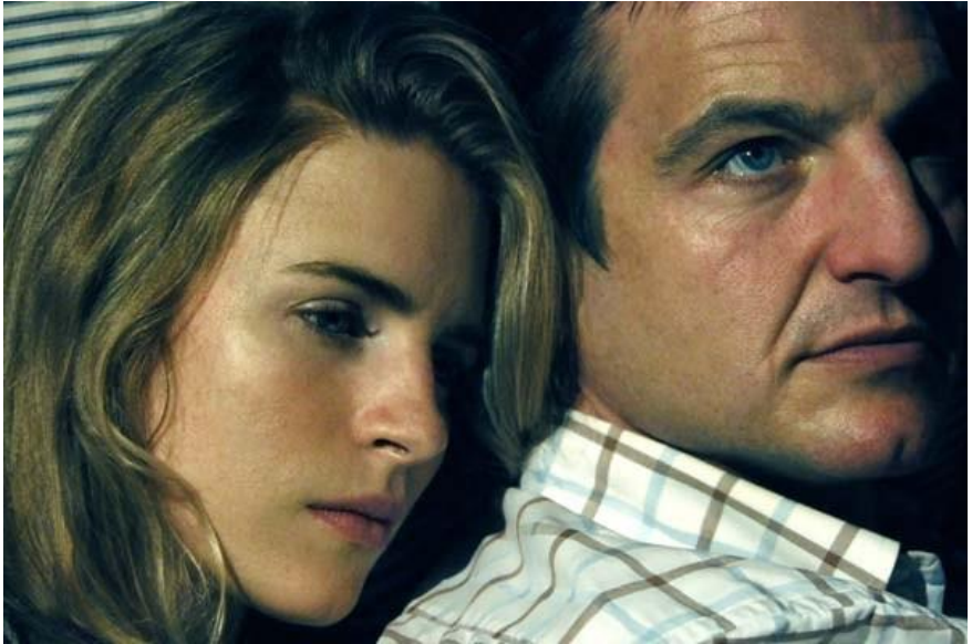
Brit Marling dans le rôle de Rhoda William Mapother dans le rôle de John

Alors qu'elle vient d'être acceptée dans une université renommée et rentre d'une soirée en voiture, Rhoda passionnée d'astrophysique apprend par la radio qu'une nouvelle planète semblable à la Terre est apparue dans le ciel. Distracte, elle provoque un accident, tuant une femme enceinte et son fils tandis que le mari, John Burroughs un compositeur talentueux, sombre dans un profond coma. Après avoir purgé une peine de quatre années de prison, Rhoda se procure l'adresse de John et découvre qu'il a sombré dans la détresse et l'alcool. Elle se fait engager chez lui comme femme de ménage. Saura-t-elle le sauver ? Dans le ciel, la planète grossit sans cesse et l'on découvre qu'il s'agit d'un double de la Terre. Chaque être humain aurait-il son propre équivalent « là-haut » ?