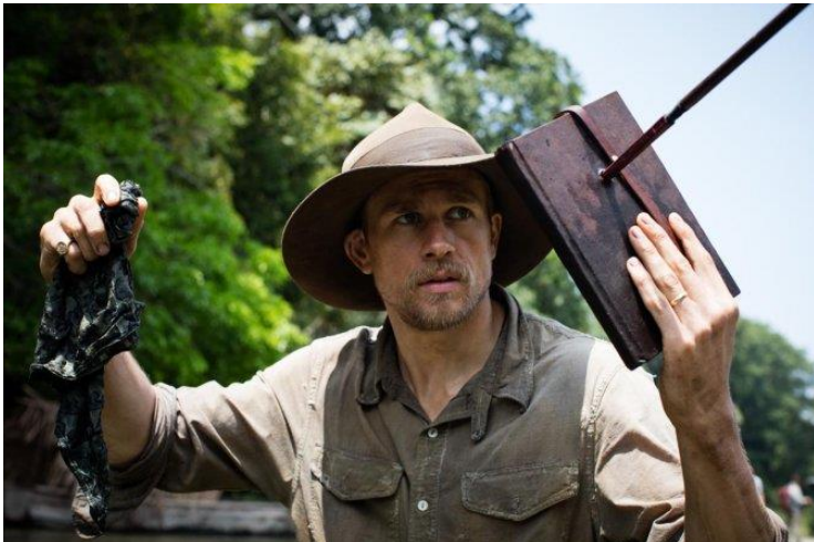
Charlie Hunnam dans le rôle de Percival Fawcett

En 1906, la Société géographique royale d'Angleterre lui propose de partir en Amazonie afin de cartographier les frontières entre le Brésil et la Bolivie car les deux pays se disputent les ressources de caoutchouc. Percy Fawcett y voit une occasion parfaite pour rétablir son nom au sein de la société anglaise. Sur place, l'homme se prend de passion pour l'exploration et découvre des traces de ce qu'il pense être une cité perdue très ancienne. De retour en Angleterre, Fawcett n'a de cesse de penser à cette mystérieuse civilisation, tiraillé entre son amour pour sa famille et sa soif d'exploration et de gloire.