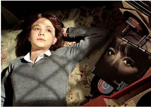
Jenny (Carey Mulligan) Meilleure actrice aux Oscars 2010

1961, Angleterre. Jenny a seize ans. Élève brillante, dans un très chic et très traditionnel établissement anglais, rêve en français, chante Juliette Gréco, lit Sartre et se prépare à intégrer Oxford. Ses parents, d'un milieu modeste, mettent tout leur espoir dans cette éducation parfaite, gage du bonheur futur de leur fille. Sa rencontre avec David, un homme deux fois plus âgé qu'elle, va tout remettre en cause. Commence alors pour Jenny une autre éducation. Elle découvre d'autres formes d'épanouissement et va devoir faire des choix.