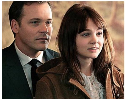
David (Peter Sarsgaard)

Le scénario d' Une Education est tiré du récit autobiographique de la britannique Lynn Barber, une des journalistes les plus célèbres du journal britannique l'Observer .