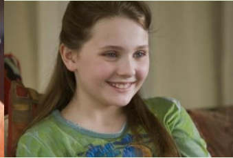
La plaideuse conçue pour sauver sa sœur