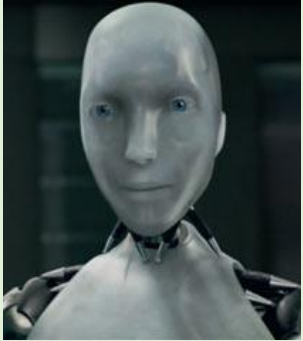
Le juge robot