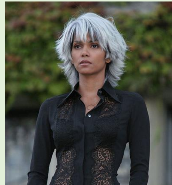
Tornado la sage

Il veut la guerre pour ne pas laisser les X-Men être exterminés par les humains. Il considère que les humains sont voués à être remplacés par les X-Men