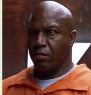
Le plaideur prisonnier