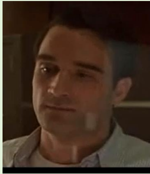
Le juge humain, père des deux frères dans Gattaca