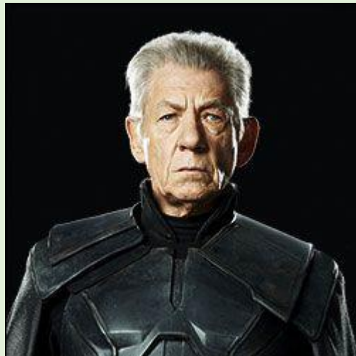
Magneto le guerrier

Elle veut que les X-Men soient vaccinés, qu'ils redeviennent des humains normaux