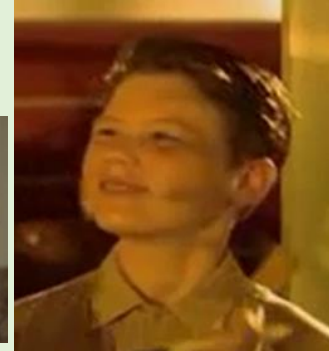
Le plaideur né par fécondation in-vitro