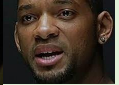
Le plaideur sauvé par le robot

Supposons une journée au tribunal où les juges doivent rendre leur verdict dans plusieurs affaires successives